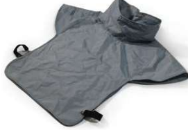
Solunum Cihazı Naylon Peterini Parça # NV2002