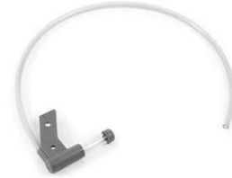
Düşük Akış Göstergesi Düzeneği Parça # NV2030