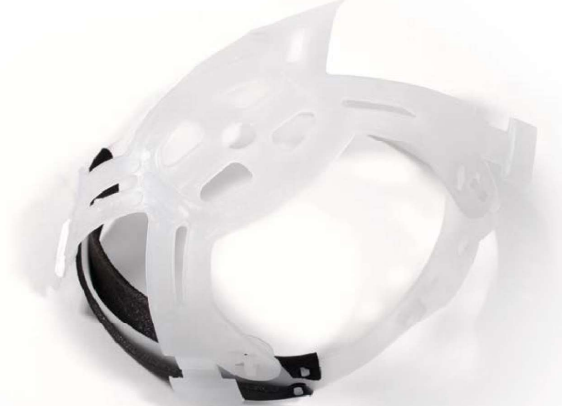
İç Başlık Düzeneği Parça # 02-809CE