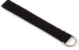
El Kayışı Parça # NV2042