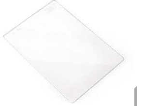
İç Lens (pk 10) Parça # 02-810