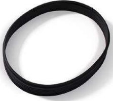
Peterin Örtüsü Bandı Parça # 02-812