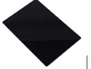
Renkli İç Lens (pk 10) Parça # 02-810-T