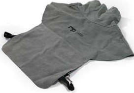
Solunum Cihazı Deri Peterini Parça # NV2002L